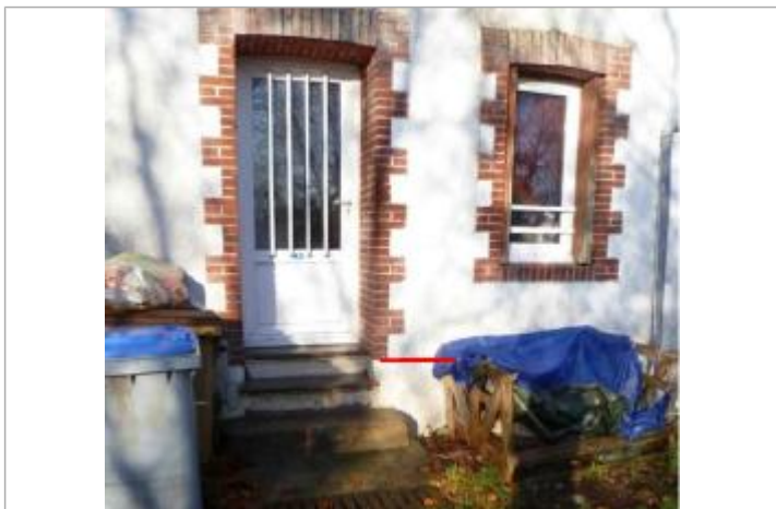
Porte de maison