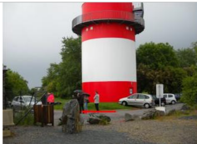
Belvédère de la Villa-Cheminée

Coordonnées WGS84 : X: -1.89688147 / Y: 47.28152580