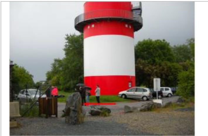
Belvédère de la Villa-Cheminée

GÉOLOCALISATION Coordonnées WGS84 : X: -1.89688147 / Y: 47.28152580 Coordonnées RGF93 (Lambert 93) X: 330079.6 / Y: 6698275.3 Coordonnées RGF93 (ETRS89) : X: -1.8968815 / Y: 47.2815258 Code Hydro: ----0000 Rive de référence: