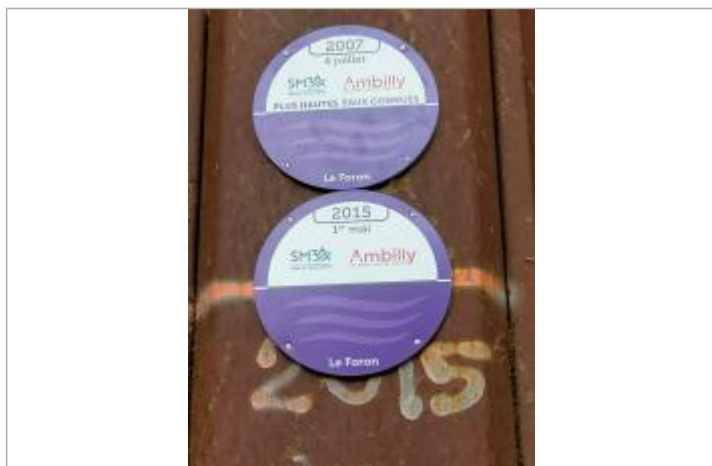
crue du foron de juillet 2007