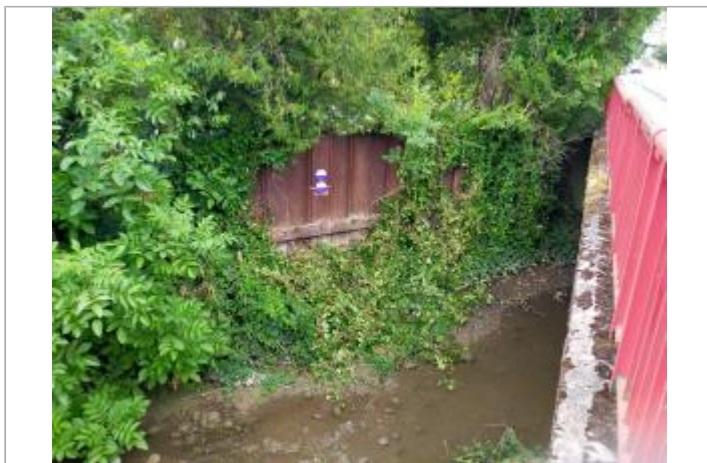
pont de mon idée

Coordonnées WGS84 : X: 6.22463965 / Y: 46.20152300