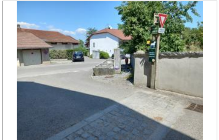
chemin des sources (Moisin)