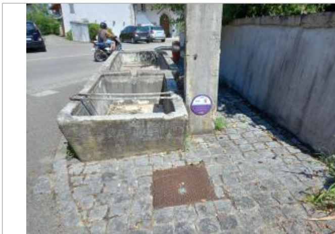
Neydens chemin de la Forge (lavoir à Moisin)