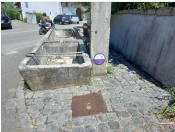
Neydens chemin de la Forge (lavoir à Moisin)