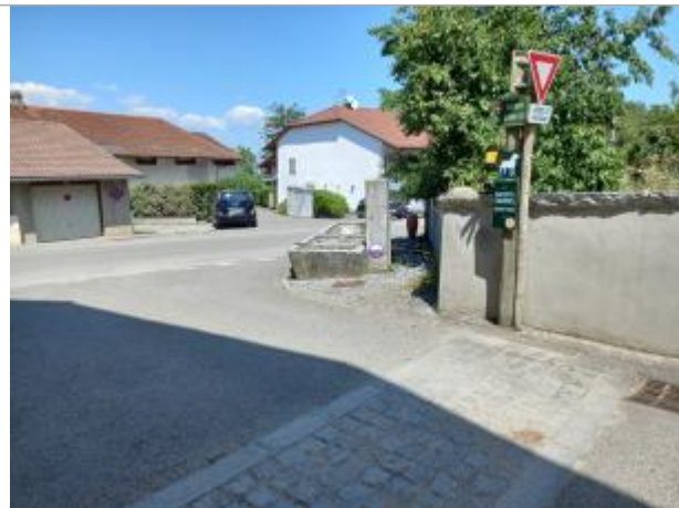
chemin des sources (Moisin)

Coordonnées WGS84 : X: 6.11215196 / Y: 46.11527750