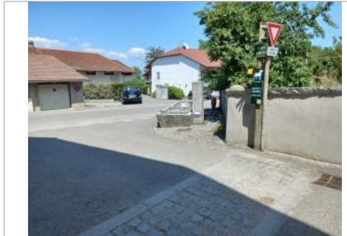
chemin des sources (Moisin)