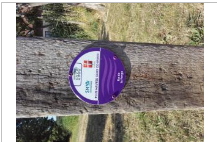
crue du ru de la Forge années 1960

Texte : crue du ru de la forge années 1960 Maximum de l'inondation : Oui Visibilité : Oui État du repère : Bon Pérennité : Longue Repère calculé : Non PHEC : Oui