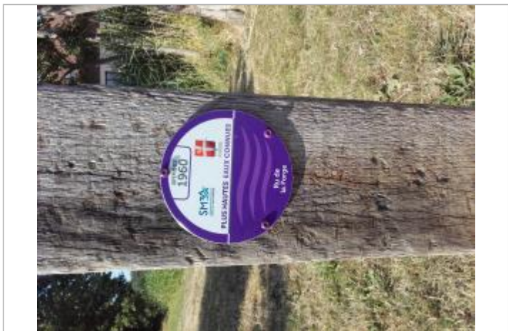
crue du ru de la Forge années 1960

MARQUE Texte : crue du ru de la forge années 1960 Maximum de l'inondation : Oui Visibilité : Oui État du repère : Bon Pérennité : Longue Repère calculé : Non PHEC : Oui