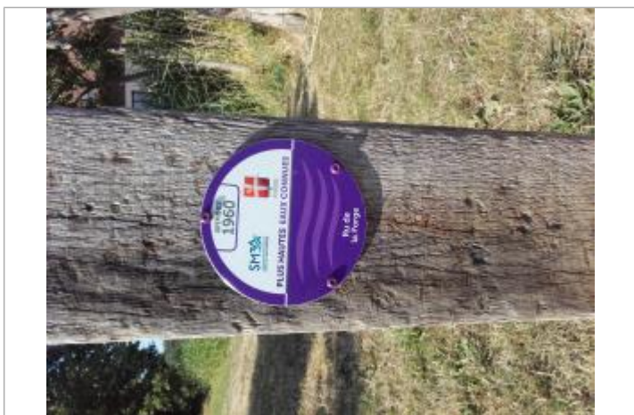
crue du ru de la Forge années 1960

Texte : crue du ru de la forge années 1960 Maximum de l'inondation : Oui Visibilité : Oui État du repère : Bon Pérennité : Longue Repère calculé : Non PHEC : Oui