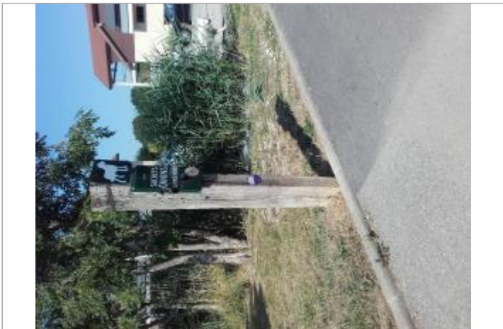
lotissement des sources