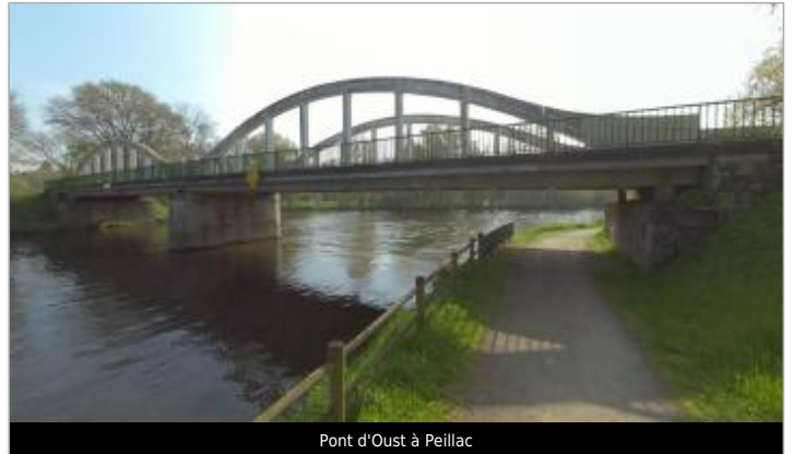
Pont d'Oust à Peillac

Coordonnées WGS84 : X: -2.21428327 / Y: 47.72923090