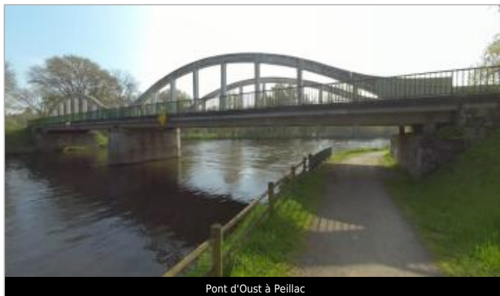
Pont d'Oust à Peillac