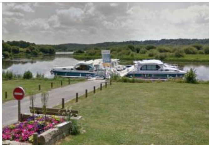
Port de plaisance à Glénac

Coordonnées WGS84 : X: -2.13348471 / Y: 47.72433600