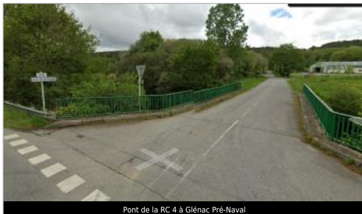
Pont de la RC 4 à Glénac Pré-Naval

Coordonnées WGS84 : X: -2.12229709 / Y: 47.74638630