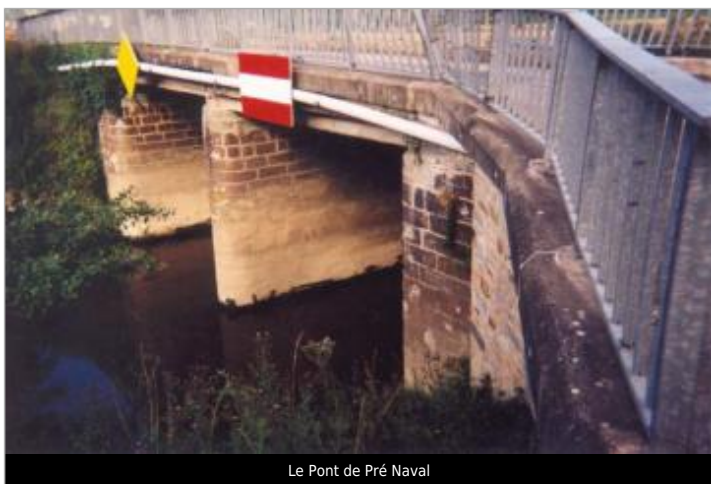
Le Pont de Pré Naval