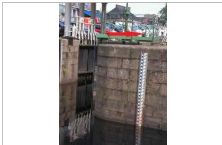
Echelle limnimétrique de la station Vigicrues

Altitude calculée de l'eau (en m) : 5.62 m