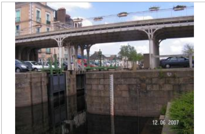
Station Vigicrues du canal de Nantes à Brest à Redon