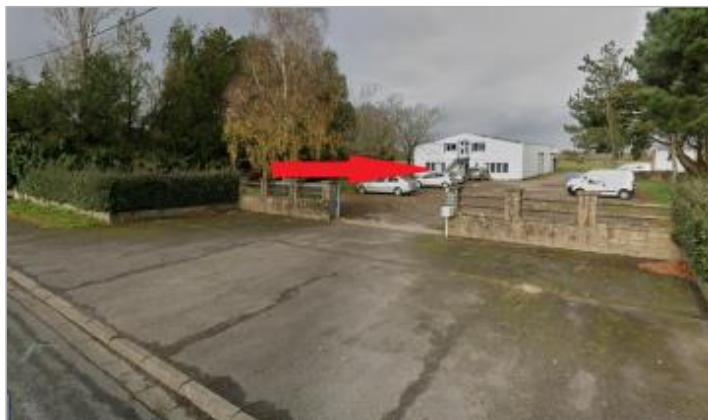
Ancien bâtiment de la DDE au 118 rue de Vannes

Coordonnées WGS84 : X: -2.09713434 / Y: 47.63736220