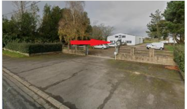
Ancien bâtiment de la DDE au 118 rue de Vannes