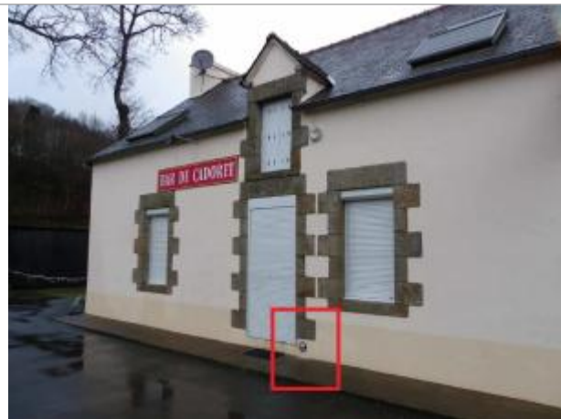
Maison au lieu-dit "Cadoret" (ancien commerce)

Coordonnées WGS84 : X: -2.65467934 / Y: 47.99858430