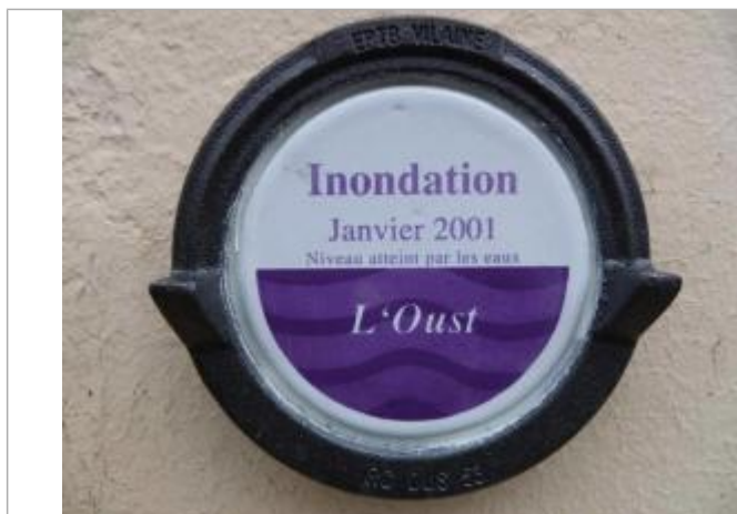
Repère normalisé sur une maison au lieu-dit ""Cadoret"" (ancien commerce)