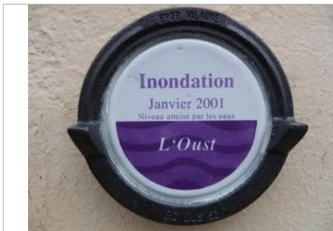
Repère normalisé sur une maison au lieu-dit ""Cadoret"" (ancien commerce)

Altitude calculée de l'eau (en m) : 45.03 m