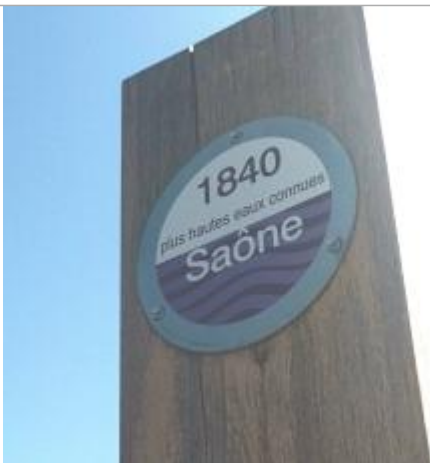
Photo du repere

Altitude calculée de l'eau (en m) : 176 m