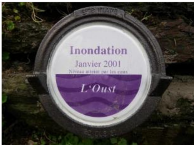
Repère normalisé sur le muret de la crêperie, coté chemin de halage

Altitude calculée de l'eau (en m) : 64.94 m