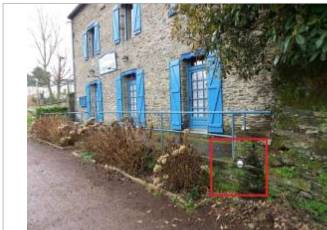
Muret de la crêperie, coté chemin de halage