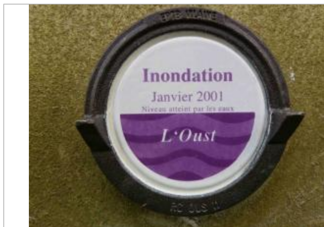
repère normalisé sur le mur de la caserne de pompiers

Altitude calculée de l'eau (en m) : 93.4 m