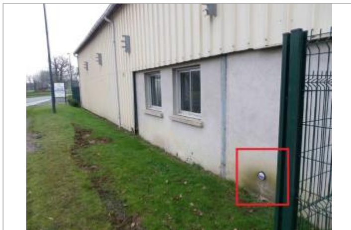
Centre d'incendie et de secours