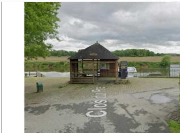
Totem sur le quai de Brain sur Vilaine

Coordonnées WGS84 : X: -1.89456360 / Y: 47.69648810