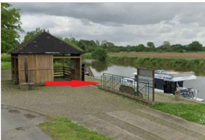
quai de Brain sur Vilaine