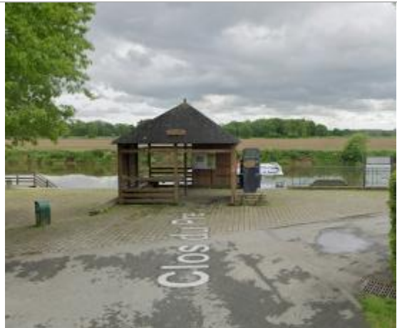
Totem sur le quai de Brain sur Vilaine

Coordonnées WGS84 : X: -1.89456360 / Y: 47.69648810