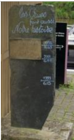
Marque gravée sur un totem en ardoise quai de Brain sur Vilaine

Altitude calculée de l'eau (en m) : 6.44 m