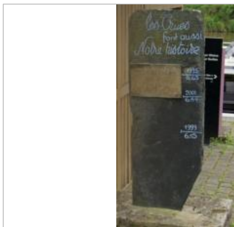
Marque gravée sur une totem en ardoise quai de Brain sur Vilaine

Altitude calculée de l'eau (en m) : 6.44 m