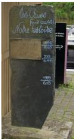
Marque gravée sur une totem en ardoise quai de Brain sur Vilaine

Altitude calculée de l'eau (en m) : 6.63 m