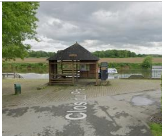
Totem sur le quai de Brain sur Vilaine

Coordonnées WGS84 : X: -1.89456360 / Y: 47.69648810