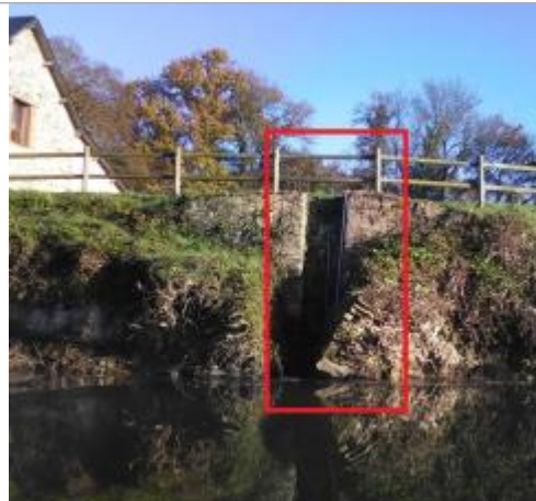
Site de la station Vigicrues d'Avessac (Painfaut) ancienne échelle pris de la Vilaine