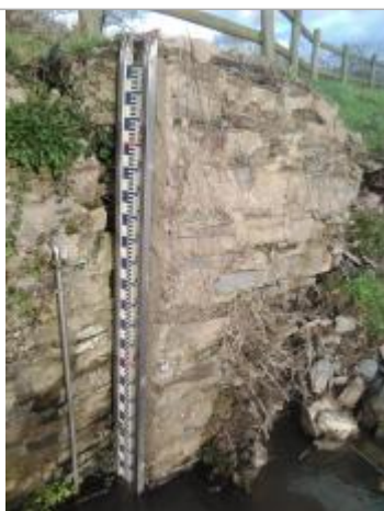
Ancienne échelle limnimétrique de la station Vigicrues d'Avessac (Painfaut)

Altitude calculée de l'eau (en m) : 6.17 m