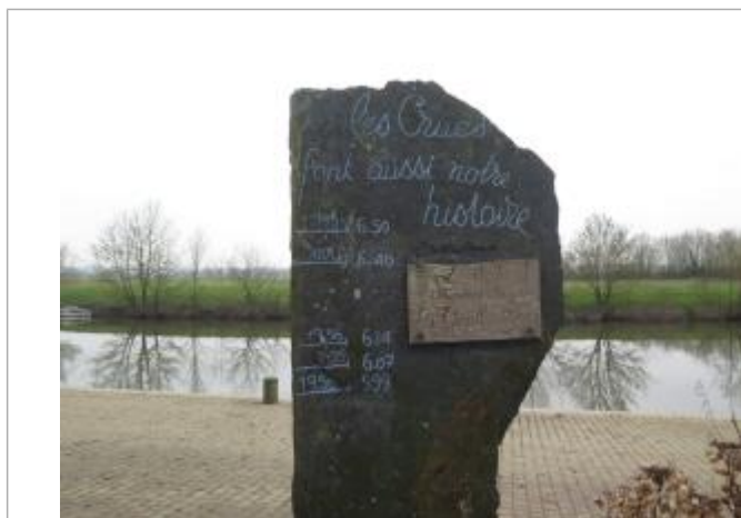
Marque gravée sur un totem en ardoise sur le quai de l'Ilette