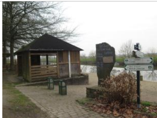
Totem et échelle limnimétrique sur le quai de l'Ilette