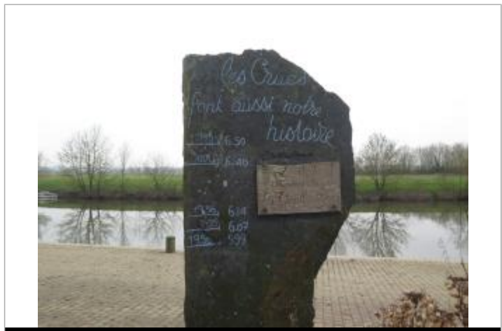
Marque gravée sur un totem en ardoise sur le quai de l'Ilette

GÉNÉRAL Code : SPC_35064_003_2001 Date de mise à jour : 11/08/2023 Auteur : SPC VCB