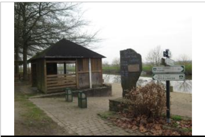
Totem et échelle limnimétrique sur le quai de l'Ilette

GÉOLOCALISATION Coordonnées WGS84 : X: -1.92759214 / Y: 47.68887550 Coordonnées RGF93 (Lambert 93) X: 330584.79 / Y: 6743584.37 Coordonnées RGF93 (ETRS89) : X: -1.9275921 / Y: 47.6888755 Code Hydro: J---0060 Rive de référence: Droite