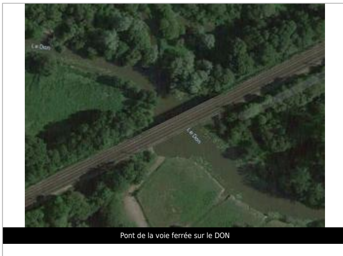
Pont de la voie ferrée sur le DON