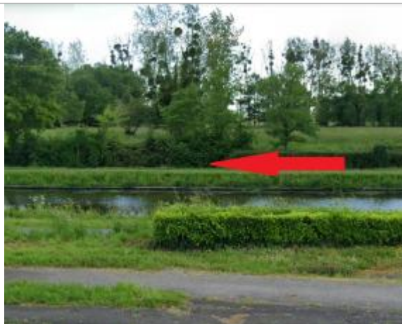
Quai de l'écluse face au centre commercial

Coordonnées WGS84 : X: -2.07720992 / Y: 47.64558430