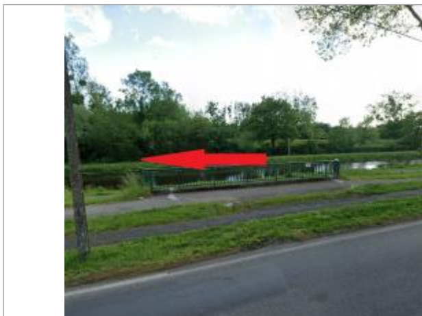
Quai de l'écluse face à la sortie de la douve

Coordonnées WGS84 : X: -2.07608646 / Y: 47.64523890