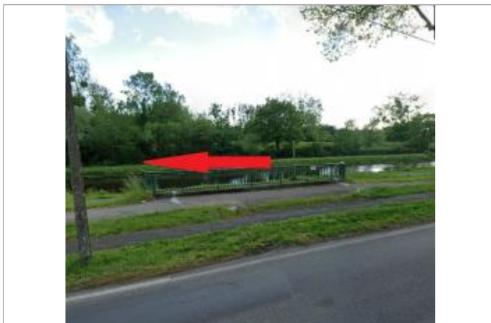
Quai de l'écluse face à la sortie de la douve