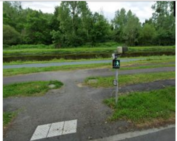
Quai de l'écluse face au passage piéton

Coordonnées WGS84 : X: -2.07769723 / Y: 47.64573850