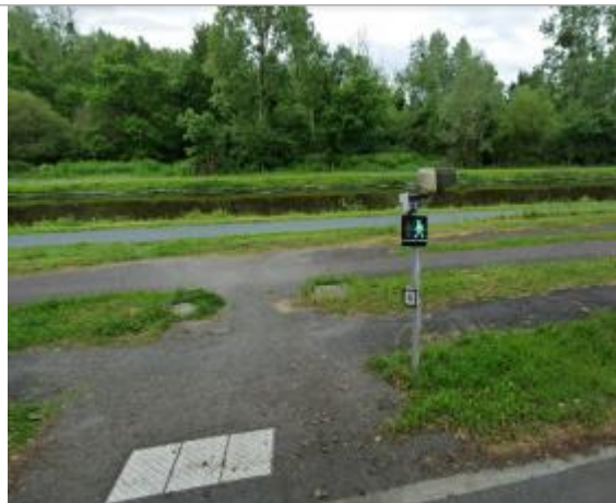
Quai de l'écluse face au passage piéton

Coordonnées WGS84 : X: -2.07769723 / Y: 47.64573850