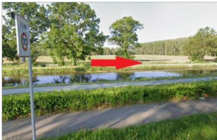
Quai de l'écluse face au parking - face au magasin de bricolage