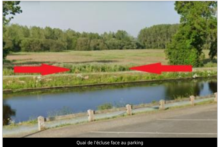
Quai de l'écluse face au parking