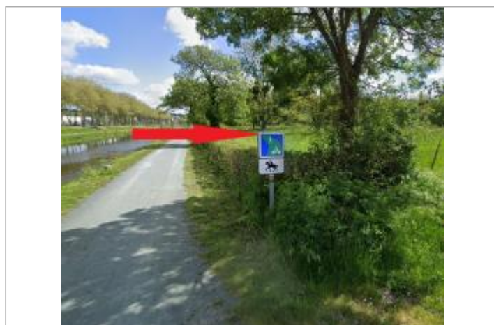
Champs sur le coté du quai de l'écluse

GÉOLOCALISATION Coordonnées WGS84 : X: -2.07925871 / Y: 47.64603000 Coordonnées RGF93 (Lambert 93) X: 318924.01 / Y: 6739554.5 Coordonnées RGF93 (ETRS89) : X: -2.0792587 / Y: 47.64603 Code Hydro: J---0060 Rive de référence: Gauche