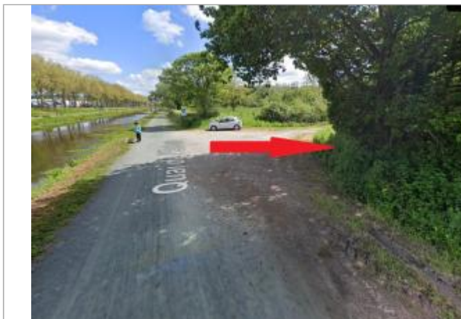
Angle du Quai de l'écluse et d'un chemin