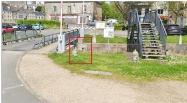
Plot de l'écluse de la digue, coté du pont