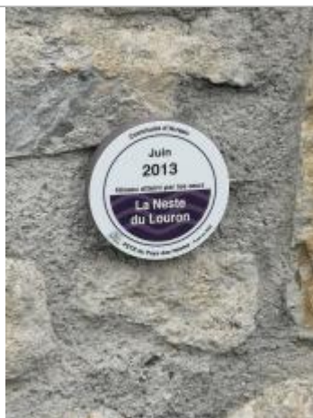
Vue rapprochée du repère, 2023.