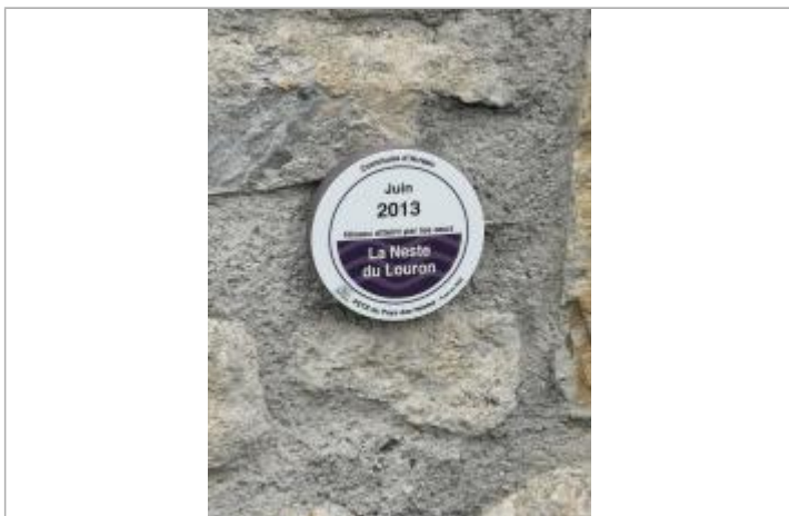
Vue rapprochée du repère, 2023.

Texte : Juin 2013 - Niveau atteint par les eaux - La Neste du Louron Maximum de l'inondation : Oui Visibilité : Oui État du repère : Bon Pérennité : Longue