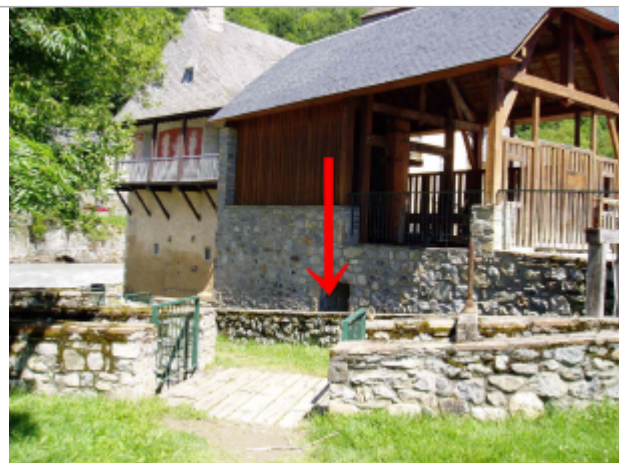
Trace de crue

Coordonnées WGS84 : X: 0.35814600 / Y: 42.90630000