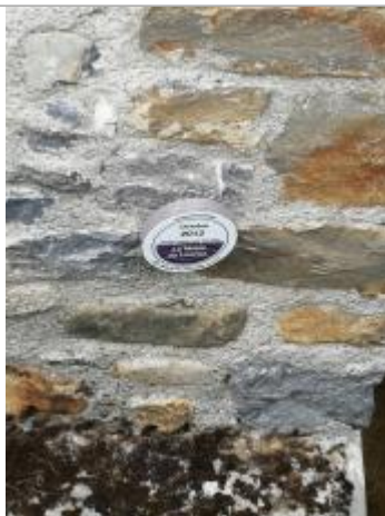
Vue rapprochée du repère, 2023.