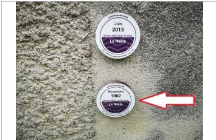
Vue rapprochée du repère, 2023.

MARQUE Texte : Novembre 1982 - Niveau atteint par les eaux - La Neste Maximum de l'inondation : Oui Visibilité : Oui État du repère : Bon Pérennité : Longue