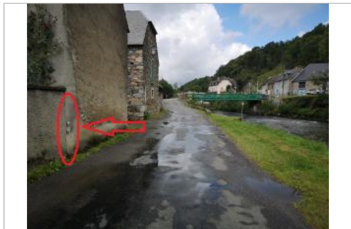
Vue générale du site, 2023.

GÉOLOCALISATION Coordonnées WGS84 : X: 0.37930522 / Y: 43.04193550 Coordonnées RGF93 (Lambert 93) X: 486309.09 / Y: 6219392.95 Coordonnées RGF93 (ETRS89) : X: 0.3793052 / Y: 43.0419355 Code Hydro: 001-0400 Rive de référence: Gauche