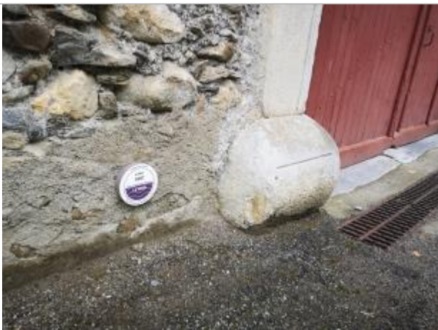
Vue du repère, 2023.