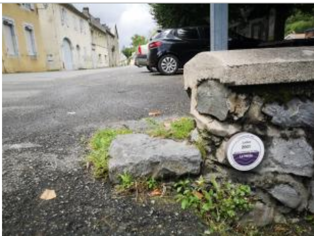
Vue du repère, 2023.