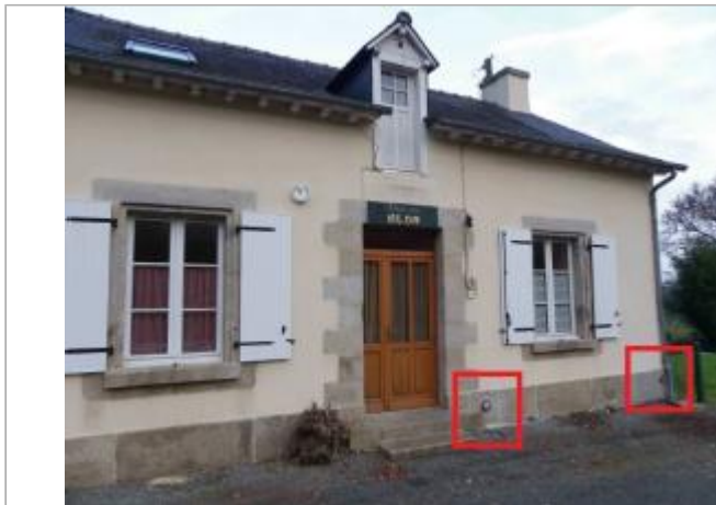
Maison éclésièrre de Blond à Guillac, repères crue et IGN