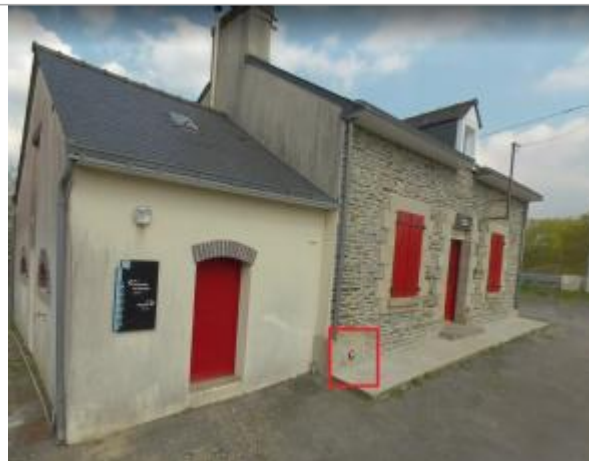
Maison éclusière de Caradec à Les Forges de Lanouée