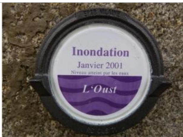
Repère normalisé de la crue de janvier 2001

Altitude calculée de l'eau (en m) : 35.72 m