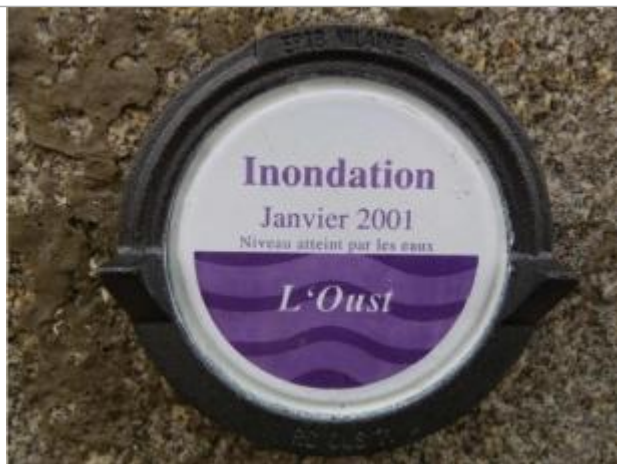
Repère normalisé de la crue de janvier 2001

Altitude calculée de l'eau (en m) : 35.72 m