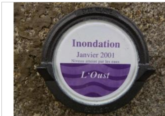
Repère normalisé de la crue de janvier 2001

Altitude calculée de l'eau (en m) : 35.72