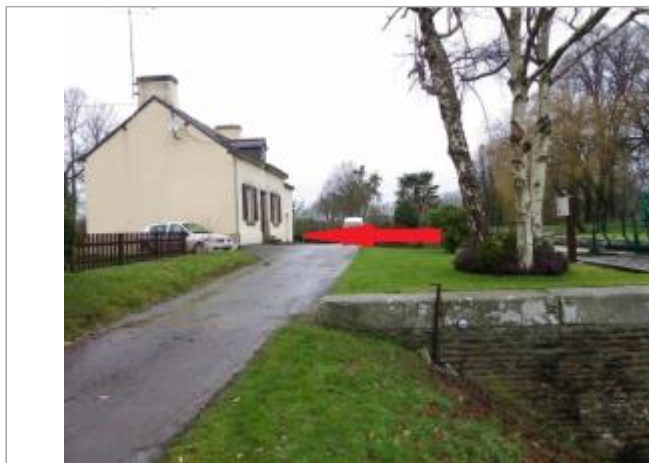
Maison éclusière de Pomeleuc à Les Forges de Lanouée