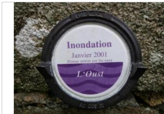
Repère normalisé de la crue de janvier 2001