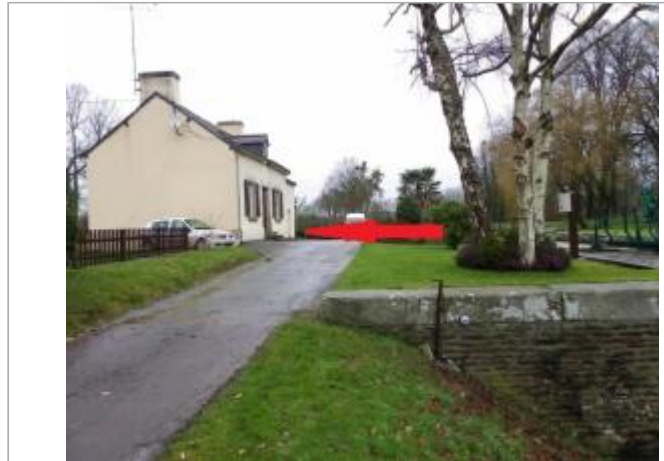
Maison éclusière de Pomeleuc à Les Forges de Lanouée