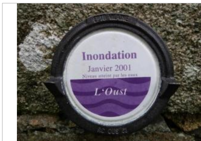
Repère normalisé de la crue de janvier 2001