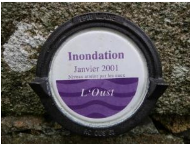
Repère normalisé de la crue de janvier 2001

Altitude calculée de l'eau (en m) : 40.28