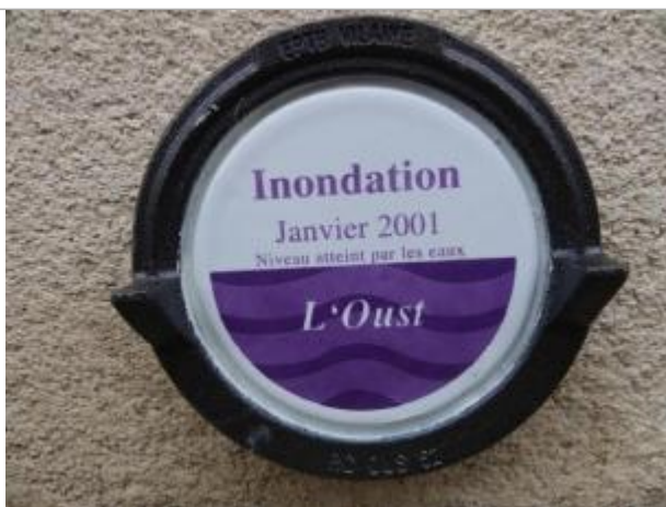
Repère normalisé de la crue de janvier 2001

Altitude calculée de l'eau (en m) : 45.52 m