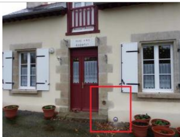
Repères IGN et crues sur la maison éclusière de Cadoret à Pleugriffet