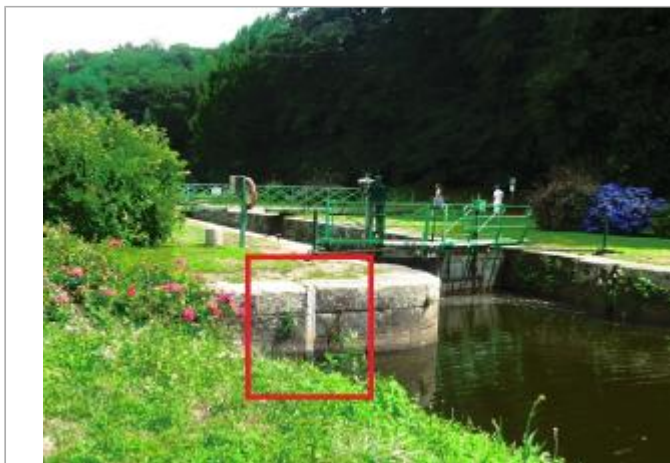
Ecluse de Beaufort échelle amont à Josselin