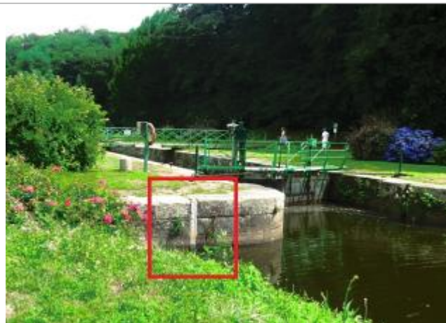
Ecluse de Beaufort échelle amont à Josselin