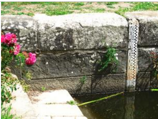
Ecluse de Beaufort échelle amont et repère IGN à Josselin

Altitude calculée de l'eau (en m) : 33.106 m