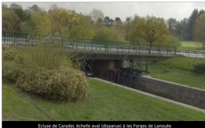
Ecluse de Caradec échelle aval (disparue) à les Forges de Lanouée