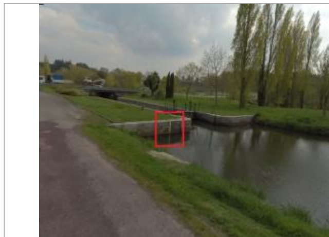
Ecluse de Caradec amont à les Forges de Lanouée