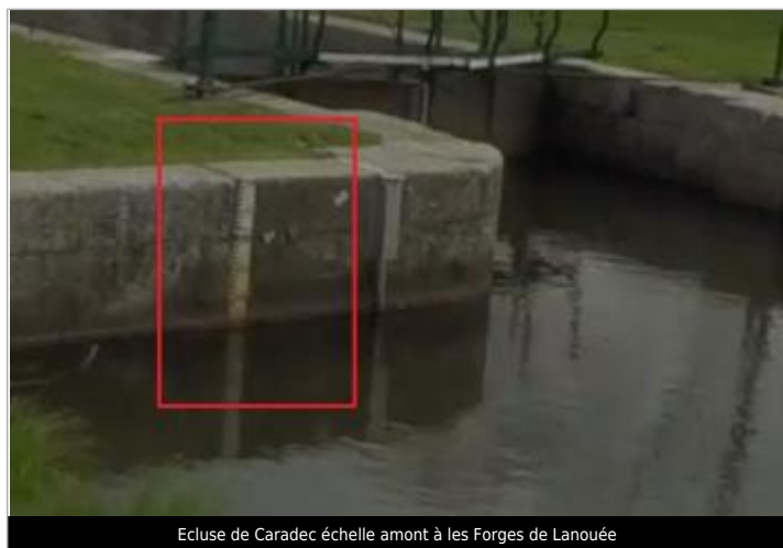
Ecluse de Caradec échelle amont à les Forges de Lanouée